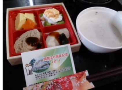
敬老の日・開院記念日