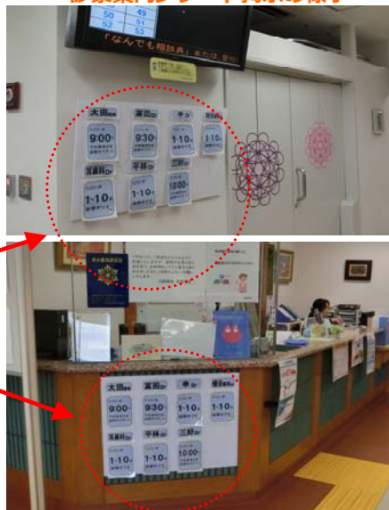
診察案内プレート掲示の様子

Shounankai Numakuma Hospital Fukuyama-Hiroshima Japan 2016