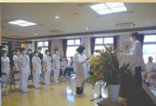
新入職員代表挨拶